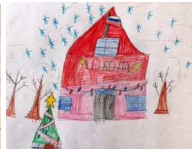
Мовсаров Малик 1 «Г»