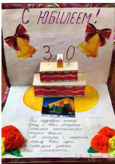
Рагозин Егор 2 «Б»