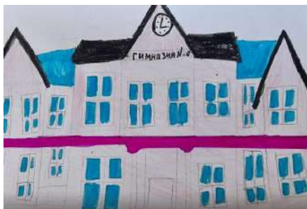
Тверетина Евгения 1 «Д»