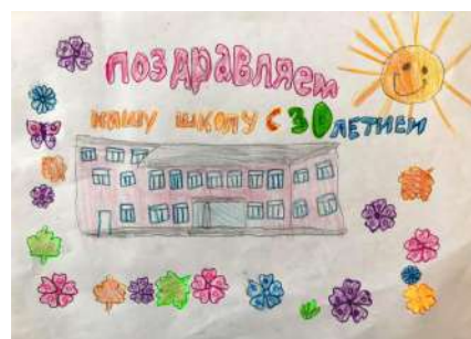
Хусейнов Некруз 2 «Г»