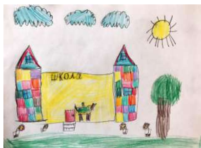
Маггерамов Тунар 1 «Г»