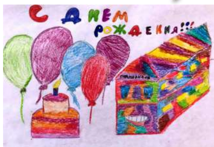
Каярлиева Лайана 3 «Б»